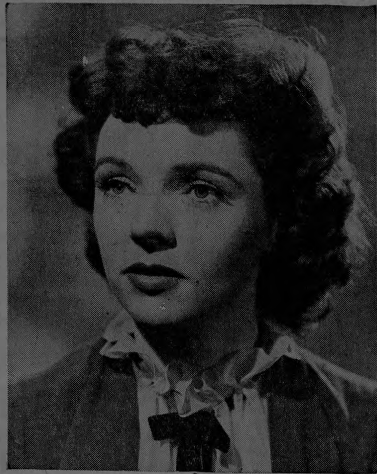
JANE WYATT es una de las pocas mujeres que están tan encantadoras con un maquillaje sofisticado como con el más sencillo y juvenil, se.

Otro error que se comete con frecuencia se refiere al de algunas mujeres que, siendo demasiado gruesas o demasiado delgadas, o teniendo las piernas de aspecto des-