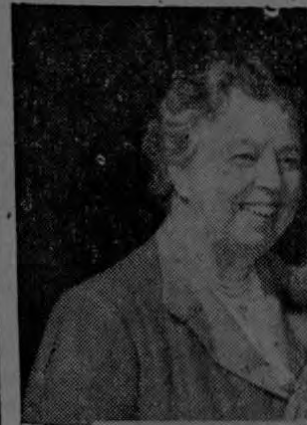
Sra. de Roosevelt

La señora Eleanor Roosevelt, viuda del famoso Presidente norteamericano que tan importante papel desempeñó en la creación de las Naciones Unidas, es quien preside la Comisión Social de la O.N.U. Hace pocos días resumió el significado de esta importante labor para el mundo entero, diciendo: